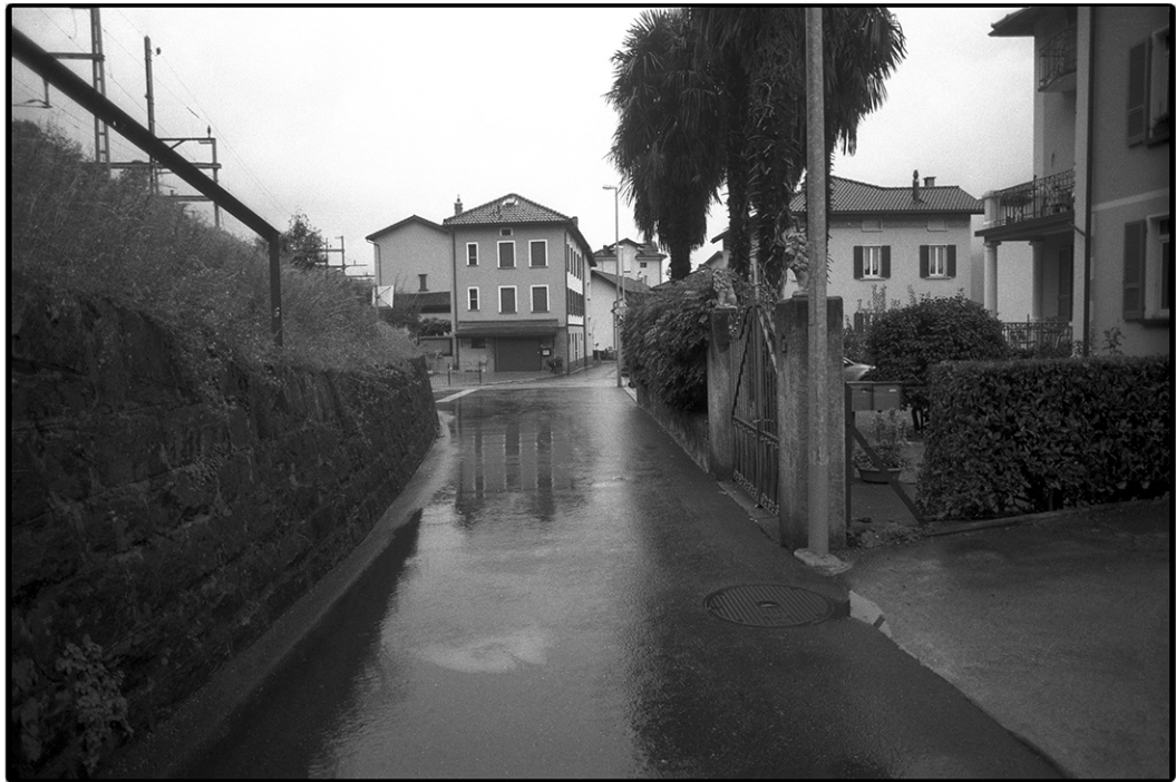
ottobre 2016, "Simmetrie" - Via Pantera, Bellinzona