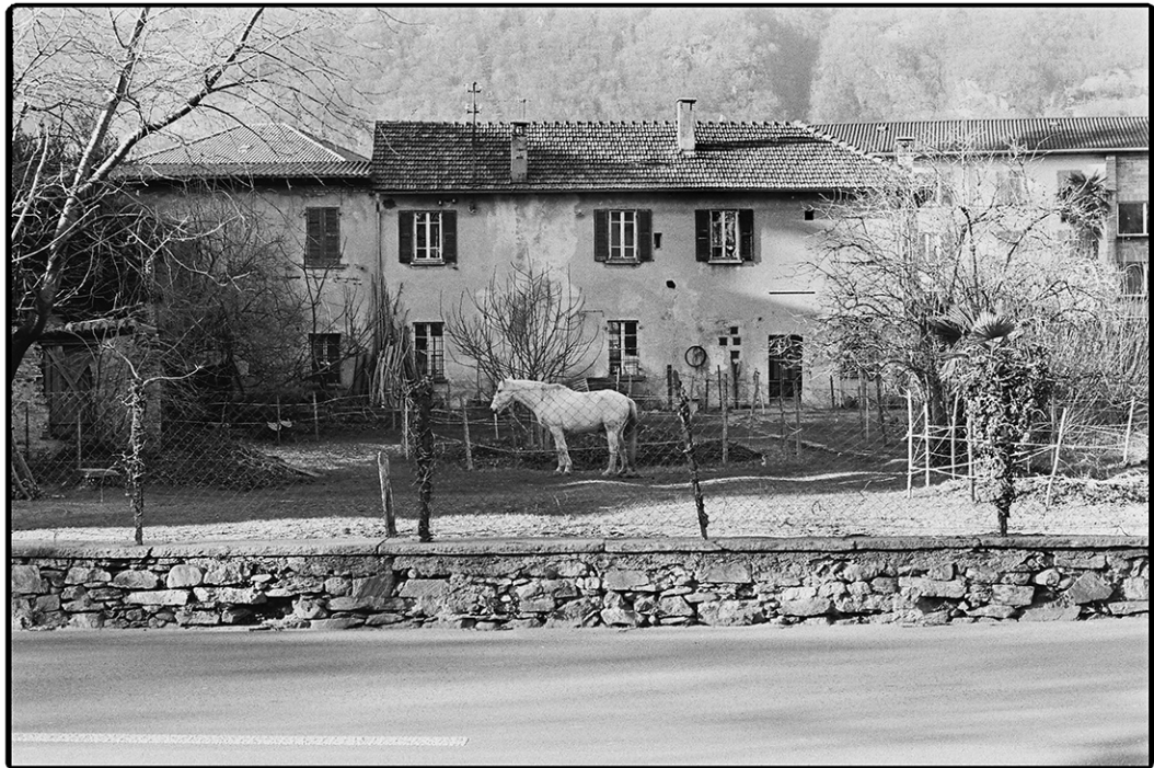
gennaio 2016, "Vallo Cavallo" - Viale Officina, Bellinzona