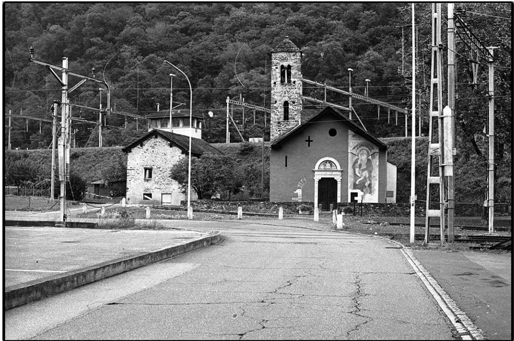
ottobre 2016, "Mezzogiorno in punto" - Chiesa rossa-Via Carmagnola, Bellinzona