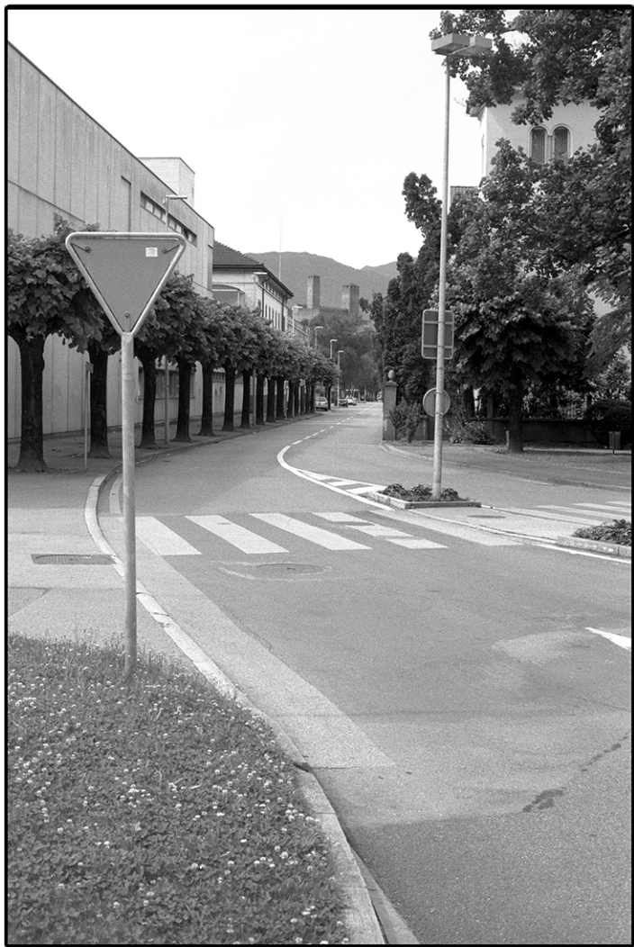
giugno 2016, "In punta di piedi" - Viale Officina, Bellinzona