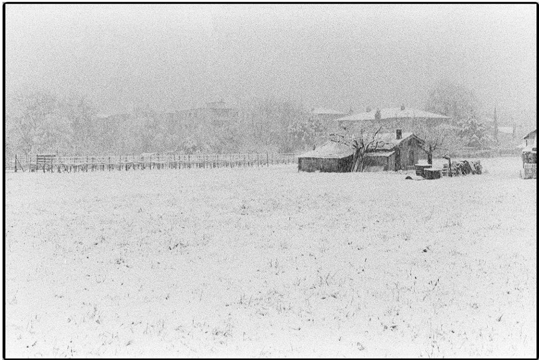
marzo 2016, "Fuori dal tempo" - Via Gerretta, Bellinzona